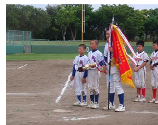
少年スポーツ交流大会

各種競技ごとに開催される交流大会の運営等に対し援助を行い、スポーツ少年団登録単位団相互の交流と新規登録単位団の加入促進を目指す。