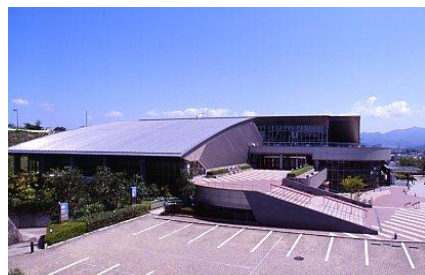
総合西市民プール