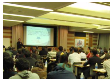
コーチングクリニック