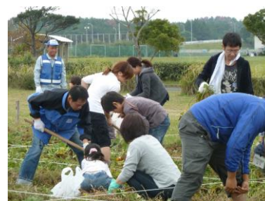
食とスポーツ教室