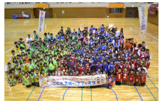
こどもスポーツフェスタ