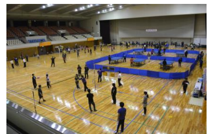
スポーツフェスタ