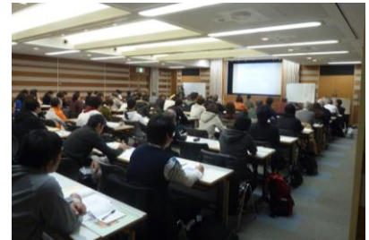
生涯スポーツ講座