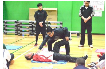
コーチング クリニック