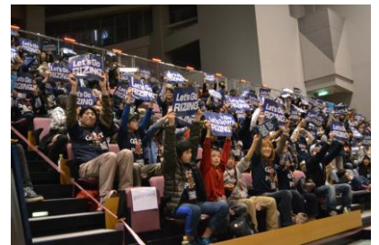
バスケットボール観戦教室