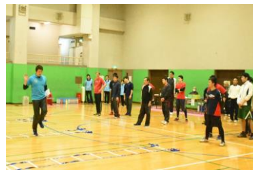
【コーチング クリニック】