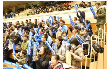
【バスケットボール観戦教室】