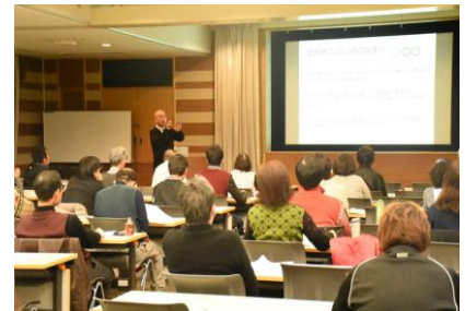
【生涯スポーツ講座】