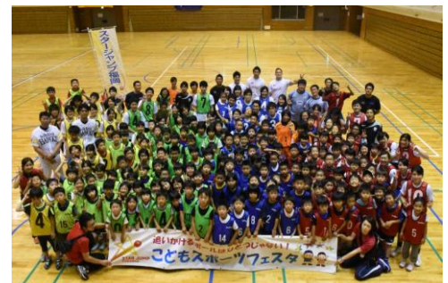
【こどもスポーツフェスタ】