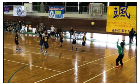
【ハンドボール大会】