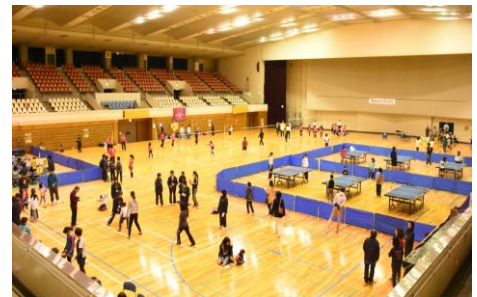
【スポーツフェスタ】