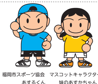
福岡市スポーツ協会 マスコットキャラクター あするくん 妹のあすかちゃん