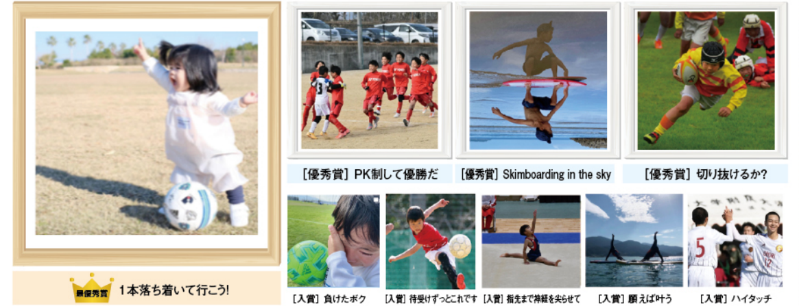
【優秀賞】PK制して優勝だ 【優秀賞】 Skimboarding in the sky 【優秀賞】 切り抜けるか? 【入賞】 1本落ち着いて行こう! 【入賞】 負けたボク 【入賞】 待受けずっとこれです 【入賞】 指先まで神経を尖らせて 【入賞】 願えば叶う 【入賞】 ハイタッチ

今年度は、各種スポーツ大会やイベントの開催が少しずつ開催され始め、スポーツ界も活気を取り戻しつつありますね!今年もまたスポーツの魅力みなさんと共有できればという思いから「Instagram スポーツフォトコンテスト」を開催いたしました。「スポーツ最高!」をテーマに、応募のあった作品を当協会広報委員が審査いたしました。すべての作品は当協会ホームページからご覧いただけます。