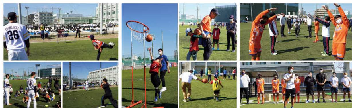
福岡ソフトバンクホークスによる野球体験教室