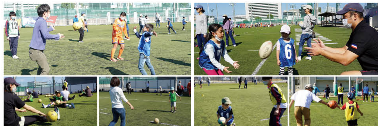
アビスパ福岡&福岡J・アンクラスによるサッカー体験教室

どの種目も、お父さん、お母さん、子どもたちの笑顔と歓声が溢れ、数年ぶりに福岡市のスポーツが活気を取り戻したのを実感した日となりました。